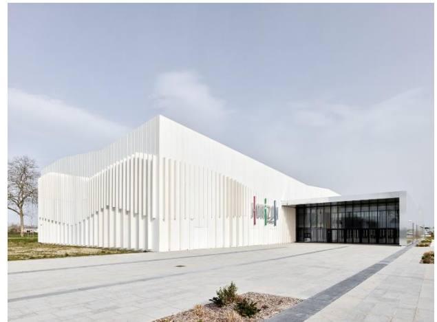
© Kevin Dolmaire Salle Horizon Muret