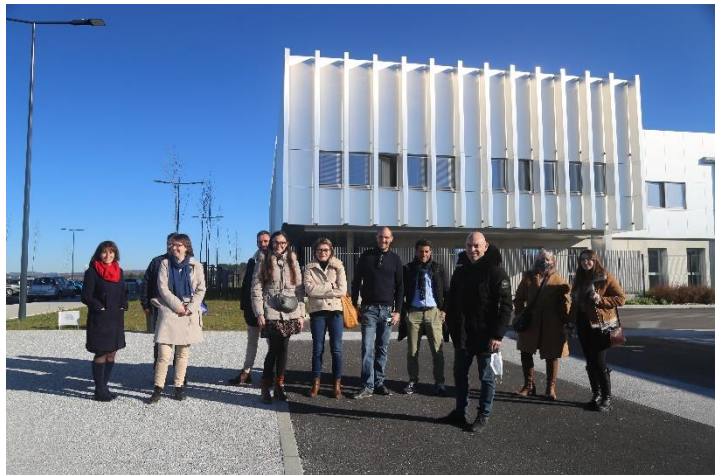
Collaborateurs ENZO & ROSSO

« Nous proposons une architecture pragmatique, adaptée au contexte et à l'usage qui s'inscrit dans les thématiques environnementales et sociétales actuelles. La Scop va faire grandir ENZO & ROSSO et permettra de faciliter le recrutement, car aujourd'hui la nouvelle génération attend beaucoup de ces nouveaux statuts. »